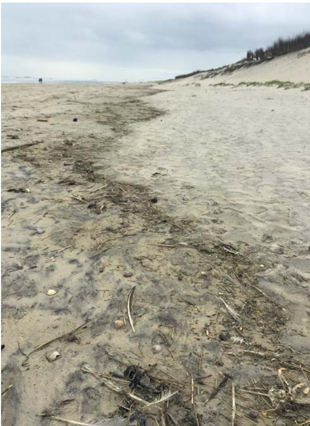
Abb. 1: Spülsaum am Strand von Wangerooge.

P arallel zur Wasserlinie im Uferbereich verlaufende Ablagerungen werden Spülsäume genannt. Ihre genaue Lage verändert sich stetig und wird meist durch den höchsten Wasserstand nach der letzten Flut markiert (Abb. 1; JANKE & KREMER 2015). Spülsäume sind ein unterschätzter und spezieller Lebensraum, welcher durch extreme Bedingungen, wie hoher Salz- und Stickstoffgehalt und starke physikalische Störung durch Wind und Wellen bestimmt wird. Die hier vorkommenden Organismen bilden daher stark spezialisierte Tier- und Pflanzengesellschaften (RUDOLPH 2011). Die Vielzahl an Lebewesen und organischen Resten bilden nicht nur eine Nahrungsgrundlage für zahlreiche Kleinstlebewesen im Spülsaum selbst und für Vögel, sie sind auch eine Nährstoffquelle für die sich an Stränden ansiedelnde Pflanzengesellschaften. Gefährdet werden diese Bereiche vor allem durch starken Badebetrieb und die zum Teil maschinell durchgeführten Säuberungsarbeiten entlang der Strände (BFN 2011).