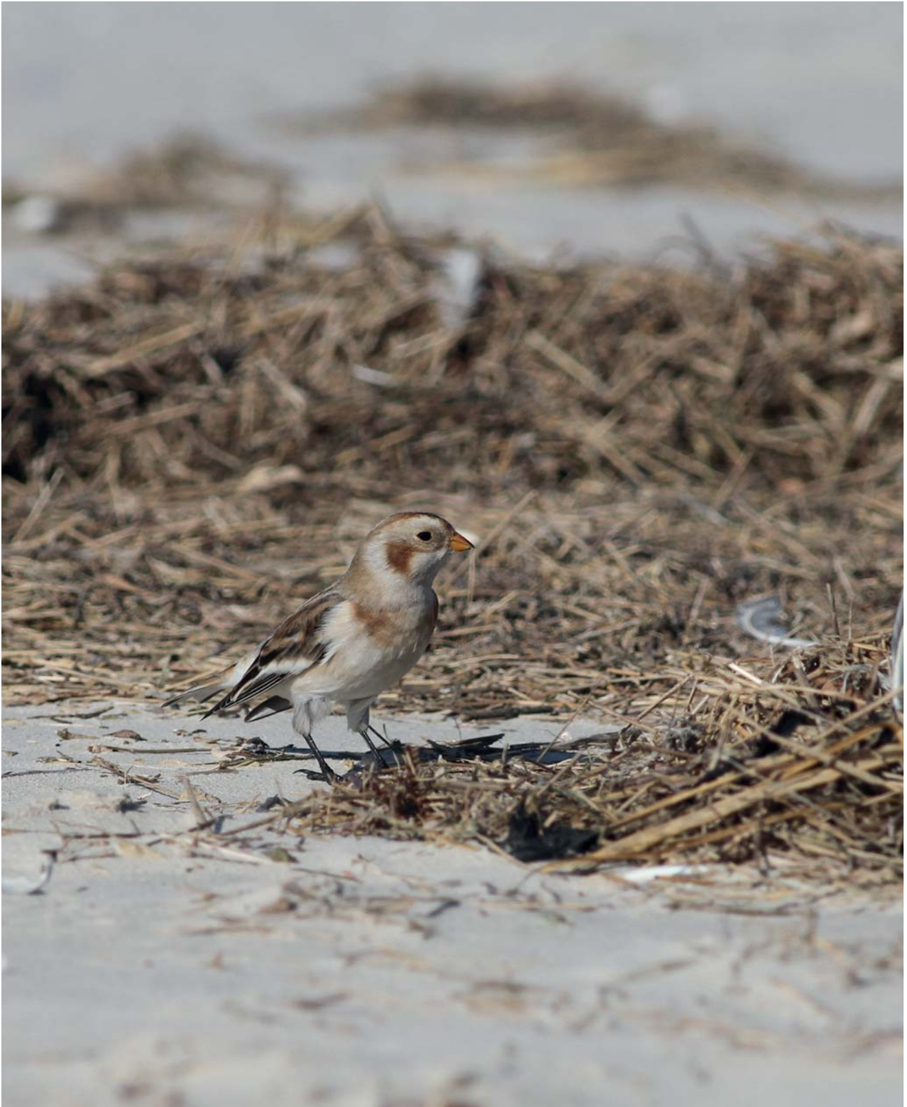
Abb. 4: Schneeammer am Spülsaum.

JANKE, K. & B.P. KREMER (2015): Düne, Strand und Wattenmeer: Tiere und Pflanzen unserer Küste. – 319 S.; Stuttgart (Franckh-Kosmos Verlag, Stuttgart).